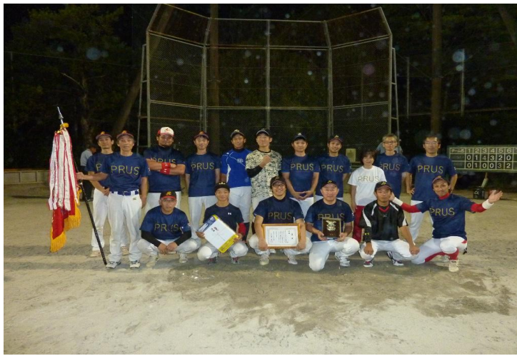
優勝・レッド・パルサーズ