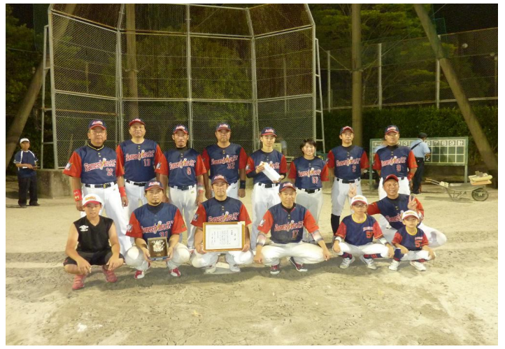
準優勝・鮫島商事SC